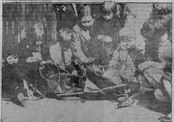
Esta fotografía, tomada en una acera de Putsburgo, muestra un encantador coro de niños que contemplan con tristeza los efectos de un choque, en que un automóvil de juguete fué destruido por otro "de veras", resultando heridos tres niños en el accidente